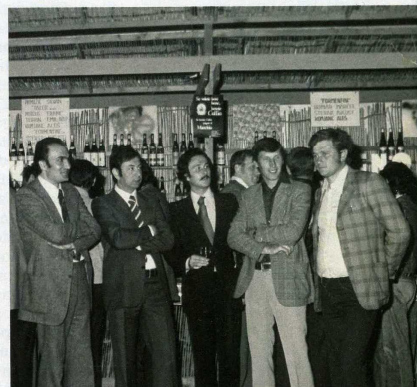
Festa del Vino a San Floriano (1975)

La moderna viticoltura nasce in Collio nella seconda metà del 1800 con l'introduzione di pregiate varietà di uve da vi-